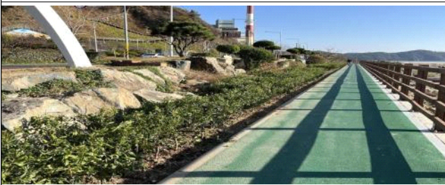
해안산책로 그린웨이 조성 완료