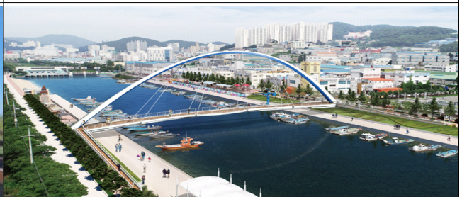
장림항 보행교 조감도