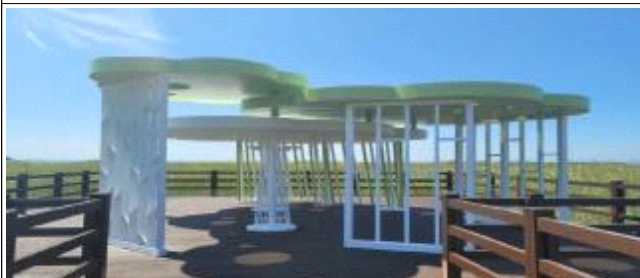
고우니 생태길 정비사업 완료